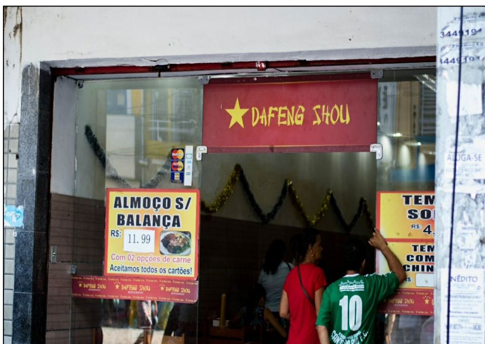
Figura 5 – Restaurante chinês na rua do Livramento – Recife

Na paisagem cotidiana dessa localidade começam a emergir traços que caracterizam o território chinês, conforme a Figura 5 que expressa a imagem da entrada de restaurante chinês com o vermelho e a estrela amarela da bandeira da RPC. É comum a cor vermelha e a nomenclatura comercial chinesa exibidas em quantidade significativa nos letreiros fixados nas fachadas das lojas (SILVA, 2016).